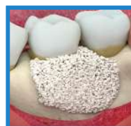
PEQUEÑOS O MEDIANOS DEFECTOS INFRAÓSEOS