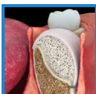
PEQUEÑOS O MEDIANOS DEFECTOS A DOS PAREDES