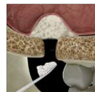
AUMENTO DEL SENO MAXILAR